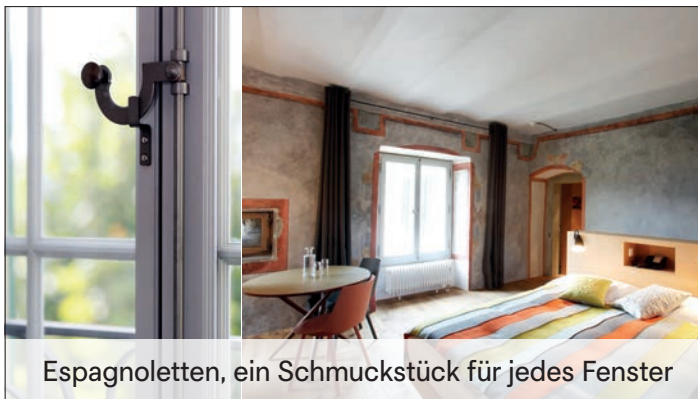
Espagnoletten, ein Schmuckstück für jedes Fenster

Espagnoletten werden individuell nach Mass gefertigt. Dabei kann das Ruder aus einem breiten Sortiment an klassischen Formen gewählt und passend zur Stange veredelt oder lackiert werden. Und was unser breites Standardsortiment nicht abdecken kann, fertigen wir in unserer Beschläge-Manufaktur in Grünen präzise auf Ihre individuellen Bedürfnisse an.